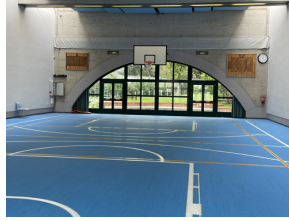
きれいになった体育館

10月1日に後期始業式を行いました。後期始業式は全校児童生徒揃って、新しくなった体育館で実施しました。後期には学習発表会やスキー体験学習など楽しみな行事があります。特に学習発表会では、特別に用意したものでなく、日頃の学習の成果を発揮してくれることを願っています。スキー体験学習も現在のイタリヤの状況では実施できそうなどということを楽しみにしています。また、後期は、次の学年に進級する心構えや責任感も準備することが必要になってきます。中学3年生は卒業に向けて進路を定める大切な時