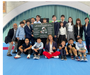
発表を頑張った中学生

中学生が環境問題を発表する 9月30日、中学生が英国で行われる COP26 の関連行事にオンラインで参加し、環境問題について発表をしました。