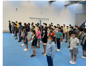
全校児童生徒が揃っての始業式

次は、後期は、次の学年に進級する心構えや責任感も準備することが必要になってきます。中学3年生は卒業に向けて進路を定める大切な時