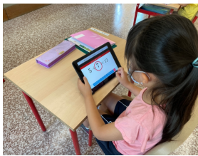
タブレットで学習する 小学1年生

☆ 学校施設開放を11日から再開します。 施設開放日 毎週 月・木・金 開放時間 15時30分～16時45分 下校 17時まで 開放場所 図書館・中庭・体育館 緑地・進路学習室 ※小学生の場合は、保護者が施設利用の監督を行なってください。